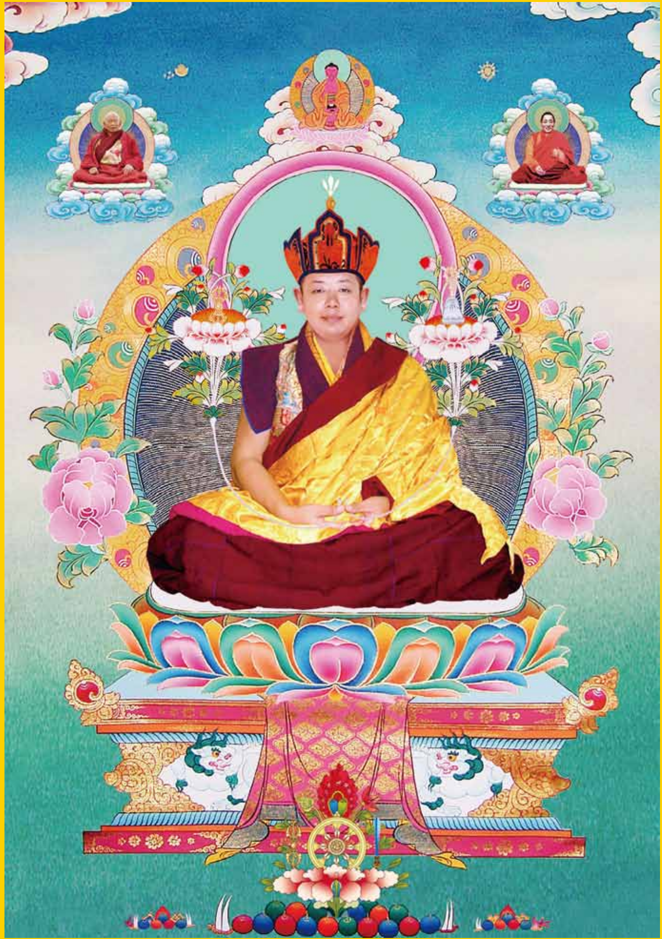
大恩根本上师普巴扎西仁波切